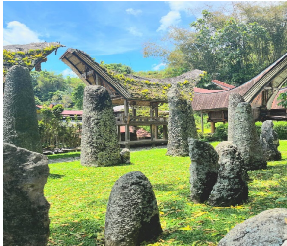
Gambar 3. Dokumentasi Batuan Menhir Kalimbuang Bori'