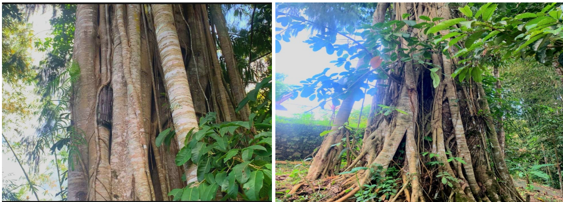
Gambar 2. Dokumentasi Pohon Baby Grave atau biasa di sebut Pohon Tarra'

Ritual pemakaman di Kalimbuang Bori', Kabupaten Toraja Utara, merupakan salah satu daya tarik budaya karena kekompleksitasan dan kaya makna dalam budaya masyarakat Toraja secara umum. Proses ini tidak hanya sekadar menguburkan jenazah, tetapi juga melibatkan serangkaian upacara yang mencerminkan keyakinan spiritual dan sosial masyarakat setempat. Salah satunya adalah budaya Rambu Solo'. Upacara Rambu Solo' adalah pesta kedukaan, upacara kematian atau pemakaman. Pelaksanaan Rambu Solo' mengandung banyak nilai dan makna. Dari kearifan lokal budaya Toraja upacara adat Rambu Solo' adalah upacara adat pemakaman sebagai bentuk penghormatan terakhir kepada seseorang yang sudah meninggal (Lumbaa et al., 2023). Salah satu ritual pemakaman yang unik di Kalimbuang Bori' adalah pemakaman bayi. Meskipun bayi yang meninggal tidak menjalani proses pemakaman yang sama seperti orang dewasa, upacara ini tetap memiliki makna yang mendalam. Umumnya bayi yang meninggal disemayamkan di dalam rumah dan keluarga akan menciptakan suasana hening kedukaan. Kemudian keluarga melakukan doa dan ritual sederhana untuk menghormati arwah bayi.