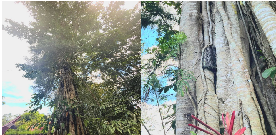
Gambar 4. Dokumentasi Pohon Baby Grave atau biasa di sebut Pohon Tarra'

lokasi pemakaman yang dikelilingi keindahan alam mendukung terciptanya suasana damai dan sakral yang selaras dengan tradisi masyarakat Toraja.